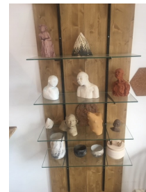
Vernissage de l'atelier céramiste - 3 juillet 2020